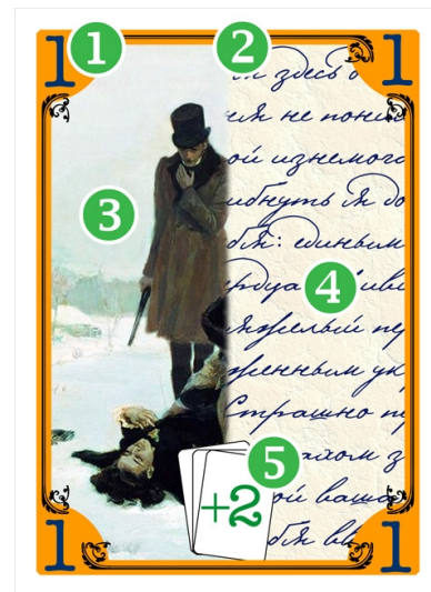
Карта: 1 – значение, 2 – цвет, 3 – картинка, 4 – текст, 5 – действие

Татьяна пытается донести до Евгения свои чувства (их обозначают начальные 4 скрытые карты), но воспитание не позволяет ей напрямую поговорить с ним – она может только намекать на них (складывая из карт новые письма). Евгений пытается разгадать цвет скрытых карт – пока не стало слишком поздно (его отъезды обозначают 5 карт с каретой – всё, что не удалось выяснить в очередной приезд, пропадает).